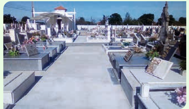
1ª fase da requalificação interior do Cemitério de Nariz