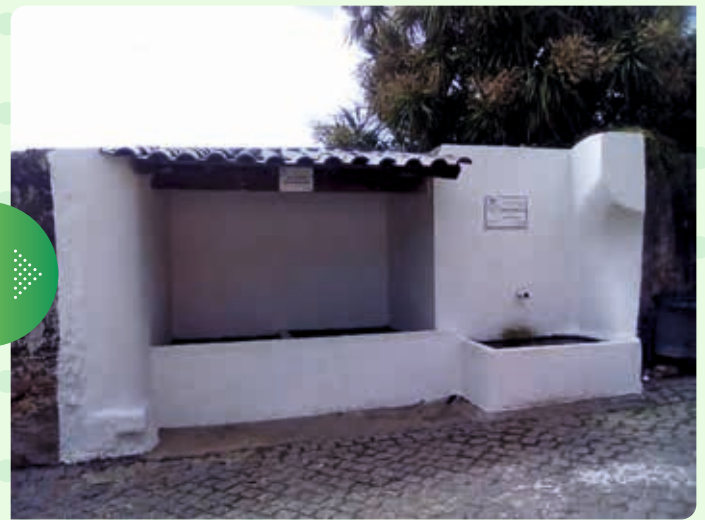
Pintura da Fonte da Rua das Poceiras e da Fonte dos Amores - Requeixo