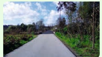
Rua da Picada