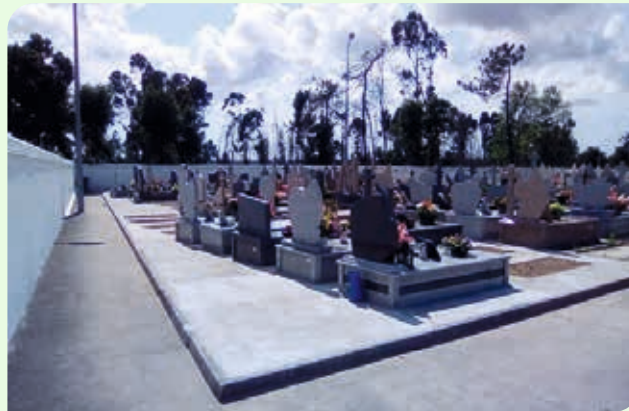
Requalificação interior do Cemitério do Viso Nª Sra de Fátima