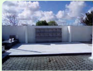
Cemitério de Nariz