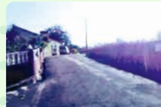
Rua do Quinchoso