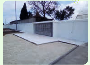
Cemitério do Viso - Nª Sra Fátima