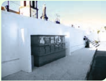
Cemitério de S. Paio - Requeixo

algum tempo ansiavam por esta obra. No total há quarenta pequenos compartimentos destinados ao depósito das cinzas provenientes da cremação dos nossos entes queridos.