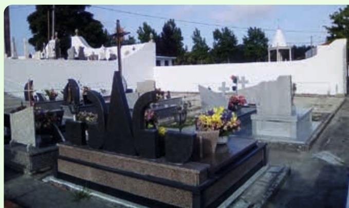
Pintura total dos muros do Cemitério de S. Paio Requeixo