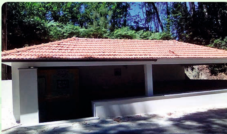
Requalificação da Fonte do Cosme Póvoa do Valado