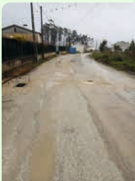
Empreitada da Rua Direita