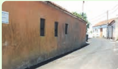
Rua da Lavoura