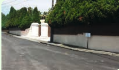
Rua da Gonçala