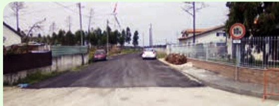
Rua do Freixo