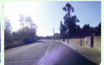
Rua do Calvário