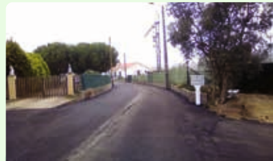
Rua Nova da Escola