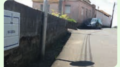
Rua da Igreja