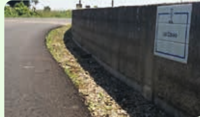
Rua do Covão