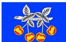
Ramo de Cerejas

Representa a produção de cereja que foi uma das principais fontes de rendimento de Nariz.