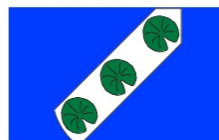
Barra de Golfares

Representam o curso de água, nomeadamente os Rios Águeda, Cértima, Vouga e a Lagoa da Pateira ou Pateira de Fermentelos onde abundam os nenúfares ou golfares; referência à antiga heráldica de Requeixo. As 3 folhas representam a união das 3 freguesias de origem.