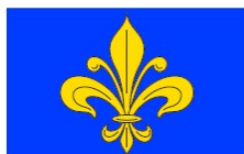
Flor de Lis

Representa N ª Sr a de Fátima, orago e topónimo de uma das freguesias de origem.